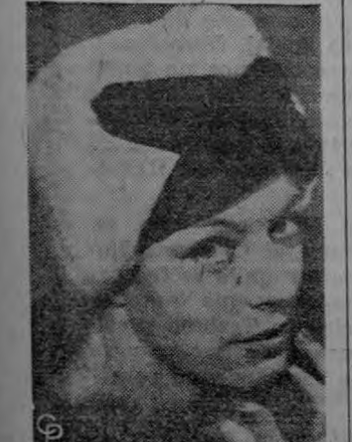
CABEZA ROJA. — La influencia de Moscú llega hasta la cabeza en este sombrero de invierno de armiño blanco con banditas cruzadas de satén negro. Vernier diseñó este sombrero con acento ruso para un desfile de modas en Londres.

MENSAJE EN ESPAÑOL El Dr. Alfonso Asenjo, destacado neurocirujano chileno Presidente de la Asociación, leyó al Presidente, en español, un mensaje en el que se expresa el agradecimiento de América Latina al aporte de Estados Unidos a la Medicina. Eisenhower se mostró animoso y locuaz en su conversación con los médicos y posteriormente posó con ellos en el jardín de rosas de la Casa Blanca. Las palabras cordiales del Presidente respecto de la hospitalidad mexicana fueron una referencia a la visita que hizo a Acapulco a principios del año, como invitado de López Mateos. Inmediatamente de su entrevista con los médicos, Eisenhower se dispuso a partir al aeropuerto para dar la bienvenida al Presidente de México.