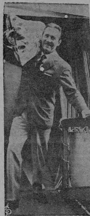
CARGANDO SU MALETA. — Cesare Siepe, estrella del Metropolitan Opera, baja del barco "Constitution", en Nueva York, con una colorida maleta al hombro. La mayor parte de los pasajeros cargaron sus propias maletas de viaje debido a que la International Longshoremen's Association (Asociación Internacional de Estibadores) y sus empleadas mantenían rígida posición en la huelga de la Costa Este

recapturarlo al poco rato, siendo conducido finalmente a la Peni, donde se encuentra en la actualidad entre rejas.