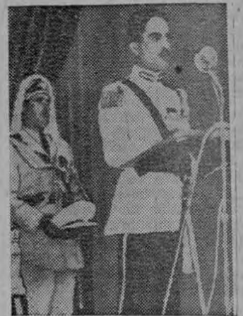
ABRE EL PARLAMENTO.—El Rey Hussein de Jordania aparece mientras abre la nueva sesión ordinaria del Parlamento, en Amman. El monarca, de 23 años de edad, dijo que "nuestra política exterior aspira a alcanzar la meta para la libertad de los árabes" y ayudar la causa de la independencia árabe.