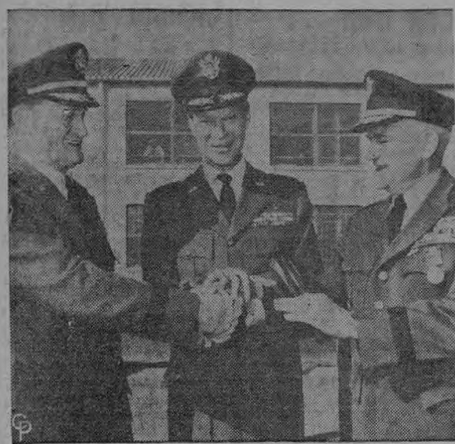
El General Lauris Norstad, comandante de la SHAPE, congratula al Gral. Charles D. Palmer, en Cam-des-Loges, Francia quien reemplaza a su hermano, el General Williston B. Palmer (derecha). Este último prestó servicios como comandante en jefe del ejército norteamericano en Europa. Los Palmer son los primeros hermanos, en la historia de los Estados Unidos, en ostentar rangos de cuatro estrellas.

WASHINGTON, 9 — (UPI). El Presidente Eisenhower conferenció hoy con sus más altos colaboradores en el Gabinete acerca de las estancadas negociaciones para la solución de la huelga siderúrgica iniciada hace 87 días, pero la Casa Blanca permaneció en el mutismo respecto a si invocará la ley Taft-Hartley para hacer a los huelguistas volver al trabajo. El Presidente escuchó el informe del Secretario de Trabajo, James Mitchell, sobre la pobre perspectiva de solventar el conflicto que afecta a 500.000 afiliados del Sindicato Siderúrgico. En la conferencia de esta mañana en la Casa Blanca participaron también otros tres miembros del Gabinete: El Secretario del Tesoro, Robert Anderson; el Procurador General (Secretario de Justicia), William Rogers, y el Secretario de Comercio, Frederick Mueller. Después de la reunión, el Jefe del Gabinete de prensa de la presidencia, James Hagerty, quien también estuvo presente, contestando a una pregunta acerca de si se había decidido solicitar una orden judicial de vuelta al trabajo durante 30 días, de acuerdo con la ley citada, manifestó: "No tengo nada que decir por ahora".